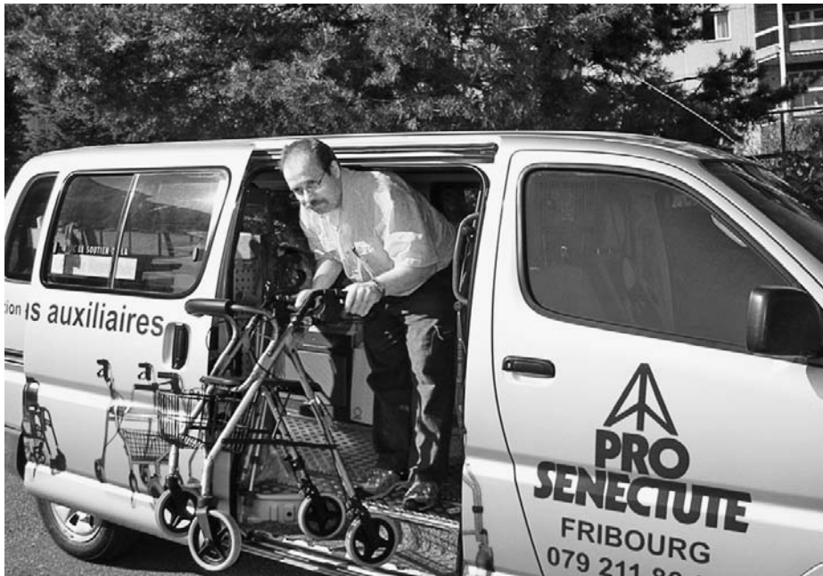
Pro Senectute Fribourg a constamment développé son offre d'aide à domicile depuis 2004. En automne 2012, il y aura désormais aussi un soutien administratif.