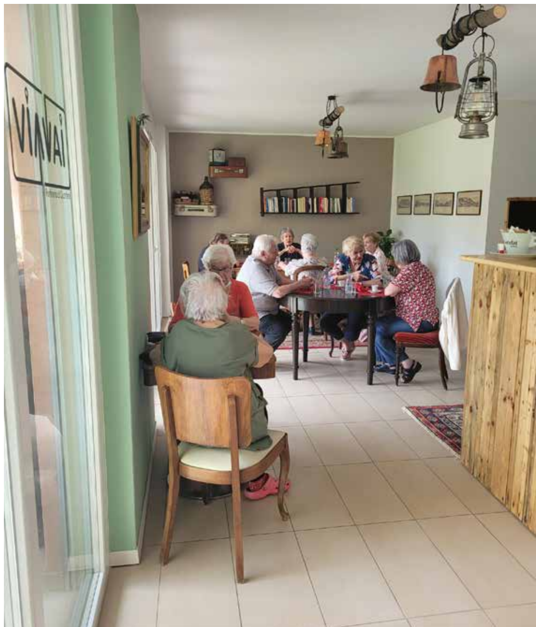
Un luogo di convivialità

Negli spazi a disposizione, come è il caso del locale al pianterreno della Residenza Mesolcina a Bellinzona, si attiva quindi un progetto comunitario. A Bellinzona, la portineria VIAVAI è aperta ormai da quasi un anno, coordinata dagli operatori di riferimento che svolgono quindi il ruolo di attivatori so-